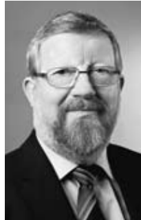
↳ Adolf Bauer ist Präsident des Sozialverband Deutschland (SoVD).

Der starke Anstieg der Strompreise wurde deshalb bei der Regelsatz-Anpassung nicht berücksichtigt. Und das ist durchaus mit dramatischen Folgen für die betroffenen Menschen verknüpft. Denn das Armutsrisiko „Energiearmut“ steigt konstant und die Prognosen sind auch auf lange Sicht düster. Studien belegen, dass Deutschland bei den Energiepreisen in Europa eine Spitzenposition einnimmt. Längst geraten immer mehr Familien aufgrund der Strompreisentwicklung in eine Kostenfalle, aus der es kaum Auswege gibt. Im schlimmsten Fall droht den Betroffenen eine Stromsperre, die zweifellos in eine extreme soziale Isolation führen kann. Diese Gefahr wurde in der bisherigen Hartz-Debatte lange Zeit schlichtweg verschwiegen. Doch nicht nur Hartz IV-Bezieher, auch Bezieher von Niedriglöhnen oder kleinen Renten machen die steigenden Strompreise enorm zu schaffen.