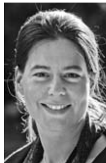
☞ Dr. Nina Scheer ist Mitglied der Grundwertekommission der SPD und Stellvertretende Vorsitzende von DL21.

Erheblich umfangreichere Preissteigerungen sind hingegen für fortbestehende